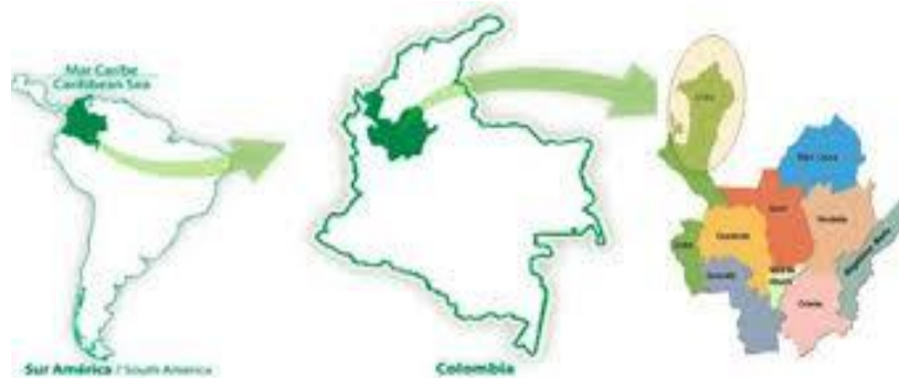
Ilustración 1. Localización General de la Subregión del Urabá Antioqueño

Aprobada mediante la Resolución Departamental N° 16861 de diciembre 05 de 2002 que le concede reconocimiento de carácter oficial a partir de 2002 (antes escuela Urbana María Auxiliadora); resolución departamental 8603 del 28 de octubre de 2004, que legaliza los estudios de educación media Académica grados 10| - 11° y Resolución 2021060000495 del 8 de enero de 2021. DANE 105172000220 NIT. 811045872-1 correo electrónico chigorodoiemaria@gmail.com